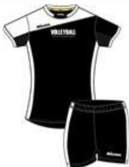
TC Trænings sæt Shigy Dame