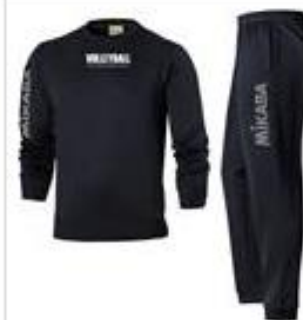
TC Opvarmnings sæt