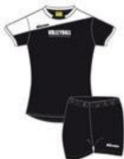
TC Trænings sæt Moach Dame