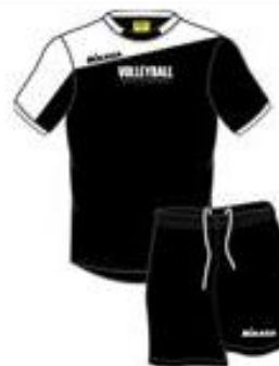
TC Trænings sæt Herre